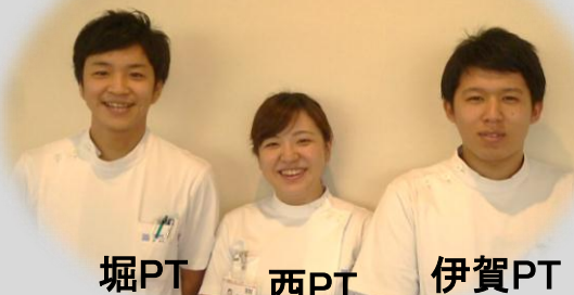
堀PT 西PT 伊賀PT